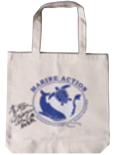
オリジナル トートバッグ 1名様