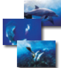
ポストカード (3枚組) 3名様