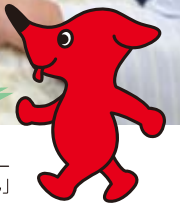
千葉県PRマスコットキャラクター「チーバくん」