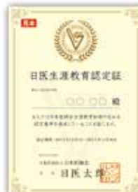
日医生涯教育認定証