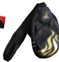
選手限定バッグ (アジア大会 2010) 1名様