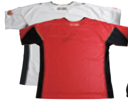
サイン入りシャツ (アジア大会出場ユニフォーム) 2名様

[応募方法]左の封書をご利用いただくか、お手持ちのハガキに左誌面の質問項目を必ず記載し、千葉県医師会「松井俊英さん読者プレゼント係」までお送りください。なお、ご希望の品名を必ず明記してください。